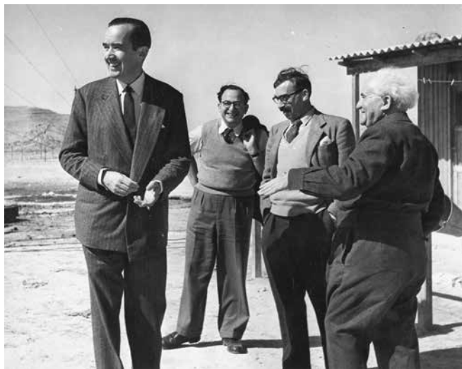
משה פרלמן בשדה בוקר עם דוד בן-גוריון, יצחק נבון ואדוארד מורו, 1956, לע"מ

ב־1952 הציג בן-גוריון למנות את זלמן ארן לסגן שר לראש הממשלה שיהיה אחראי לנושא ההסברה. בן-גוריון מנה את כלי ההסברה שיעמדו לרשות ארן: העיתונות, הסיעה בכנסת, "טובי המנגנון הממשלתי" (פקידות בכירה), מכשירי החינוך וההסברה בצבא ועוד. ארן לא השתכנע לקבל את המשימה ללא תקציב נאות. ב־1955 קיבל השר ללא תיק, זלמן ארן, את האחריות למרכז ההסברה ואילו לע"מ ורשות השידור נשארו במשרד ראש הממשלה (מן, 2012).